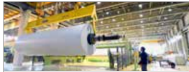
Industrie du papier et de la pâte à bois