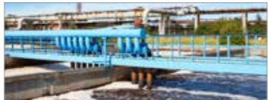
Traitement des eaux usées