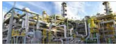
Technologie des procédés chimie et pharma