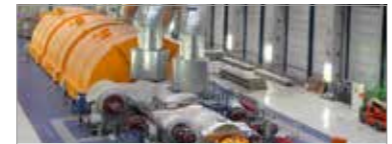
Technique de l'énergie et des centrales