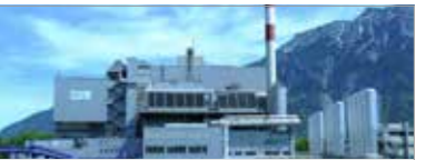
Incinération des déchets

MUNSCH Kunststoffpumpen für aggressive Medien