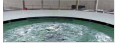
Alimentation en eau