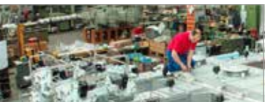
Construction de machine